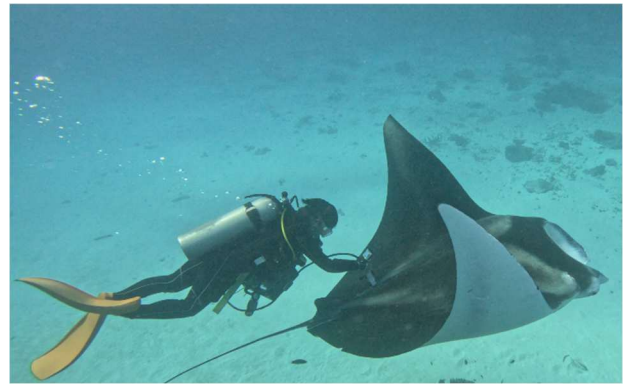
写真-3 オーストラリア・グレートバリアリーフにおけるナンヨウマンタ調査

今後も同様の調査を継続しデータの蓄積を行うことで、野生ナンヨウマンタの繁殖周期および妊娠周期の解明を行い、本種の繁殖生態の解明に寄与していくことが期待される。