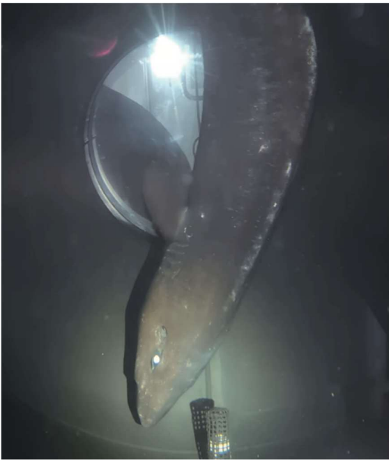
写真-2 浸透圧治療中のチヒロザメ