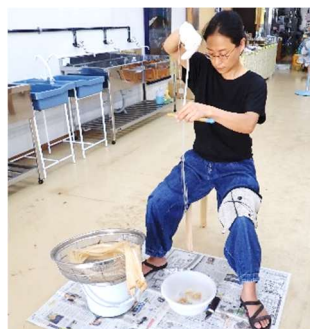
写真-2 クロスセクション用のウー引き