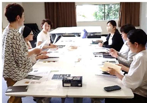
写真-1 ワーキング会議