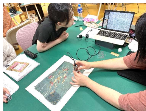
写真-5 染織布の繊維鑑別