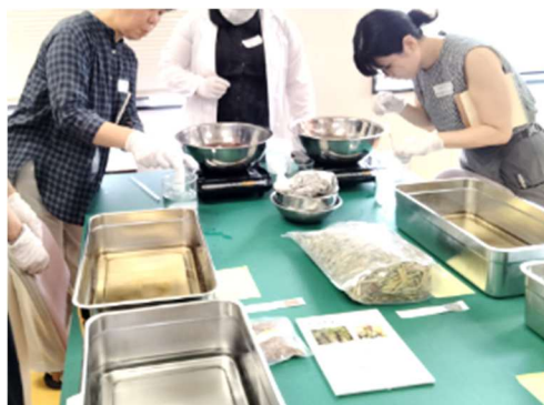
写真-4 天然染料染色による布のクロマトグラフィー分析