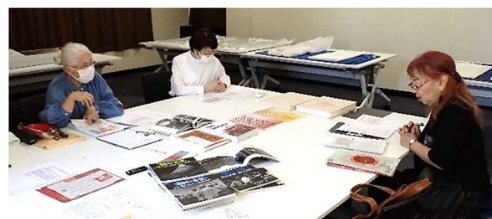
写真-3 評価委員会の様子