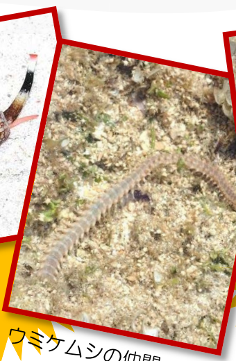
ウミケムシの仲間