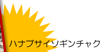
ハナブサイソギンチャク