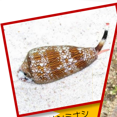
タガヤサンミナシ

海で見かける危険な生き物。 危険なところはどこでしょう？スライドや標本を使って観察してみましょ。また、危険な生き物の被害を最小限におさえるにはどのようにしたら良いのか学習しましょう。