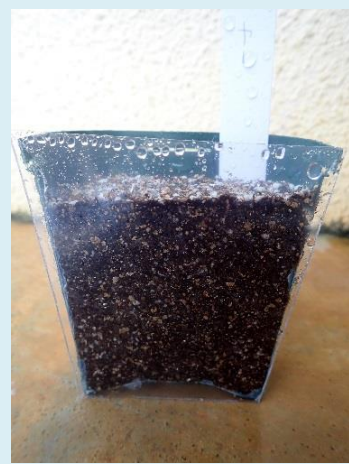
タネはとうめいのシートの すぐ近くにまき。