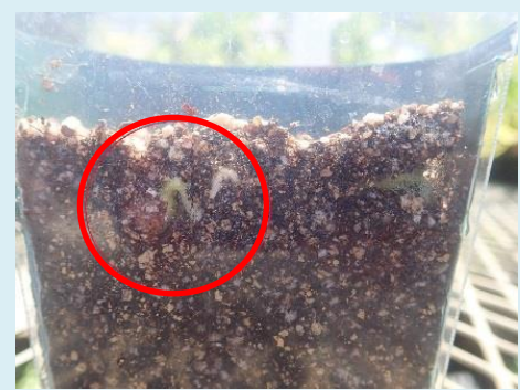
土の中のように見える。