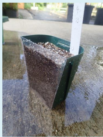
はんぶん に切って、 とうめいシートをはる