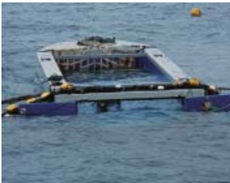
定置網でのコンテナ設置

サメをコンテナに入れる頃には2mほどになるまで絞られています。このころになるとさすがの「のんびり屋」のジンベエザメも暴れ出します。網のたるみも多くなり、この部分に入り込まれると網に絡まる恐れもあるので、細心の注意を払ってコンテナの中へ誘導します(写真)。 暴れるジンベエザメを上手く誘導するコツは、ジンベエザメの眼を手で押