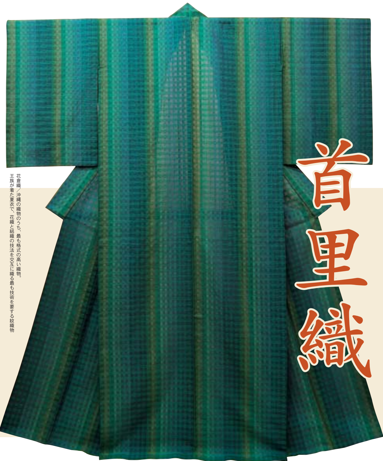
花倉織／沖縄の織物のうち、最も格式の高い織物 王族が着た夏衣で、花織と縞織の技法を交互に織る最も技術を要する紋織物