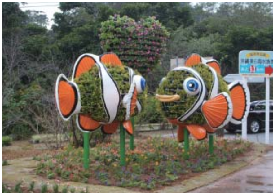
カクレクマノミのカップル（本部町伊豆味） カクレクマノミのカップルとハートの造形によって、愛情と平和、自然との共生を表現しています。カクレクマノミは高さ2m幅1.5mです