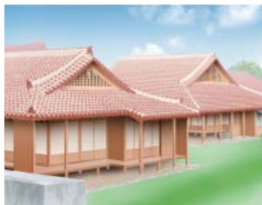
書院・鎖之間外観イメージ図

平成十八年度 首里城公園 「新春の宴」 実施日時/平成十九年二月(月)〜三月(水)まで 実施場所/首里城公園御庭・下之御座 実施概要/期間中、首里城ならではの特色ある正月装飾が施された御庭にて「朝拜御儀式」という琉球王朝時代の朝賀の儀式を三部構成にて再現します。