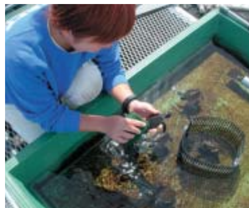
当水族館で孵化した仔ガメの甲羅みがき

環境整備 鯨類の飼育施設として、オキちゃん劇場、いるがスタジオ、イルカラグーンの3施設があり、飼育展示およびショーを運営しています。各施設、週に1〜2回の頻度でプール掃除を行い良好な環境を保つようにしています(写真・写真)。