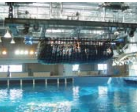
黒潮大水槽の上まで運ばれたジンベエザメ