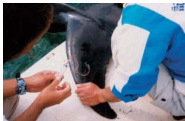
血液検査=尾鰭からの採血

健康管理 しかし、いくら良い水、良い餌、良い環境で飼育していても病気は避けられません。主な疾病は感染症や外傷などですが、時にはストレスが要因となり病気をひきおこす場合もあります。健康管理は、疾病の早期発見と早期治療が重要です。これらは、摂餌の状態や一般行動、ショー動作等、係員の観察に基づき、「主観的な方法」と、体温測定、血液検査や細菌検査等による「客観的な方法」により判断することができ(写真・写真)。