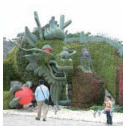
写真は昨年度の実施状況です