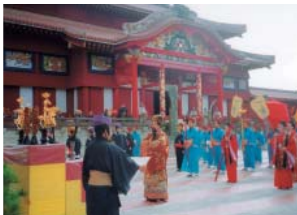
子之方御拝(国王の拝礼)