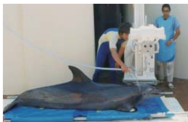
餌以外のものを食べてしまった時などにはX線検査を行い異物を確認します