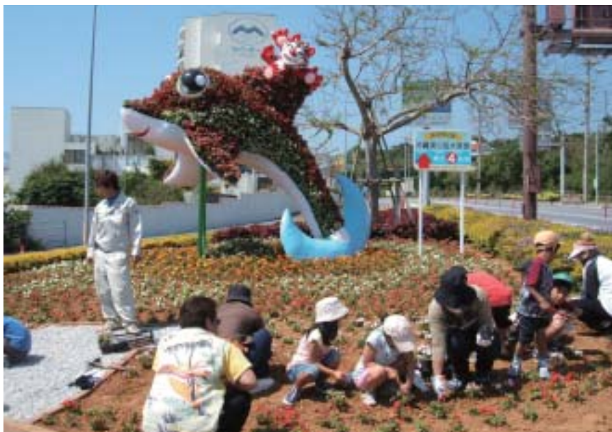
イルカとシーサー君（本部大橋交差点） 沖縄美ら海水族館を代表するイルカのオキちゃん、沖縄を守るシーサーを組み合わせて美ら海を守る心を大切にしたいという思いがデザインされています。高さ3.5m幅4mです

年間を通した主な維持管理作業には4回/年の草花の入れ替え、灌水、花柄摘み、台風対策、生育不良株の取り替えなどがあります。草花の入れ替えには動物本来の持つ色合いとラインを草花の鮮やかな色合いで表現するようにデザインしています。灌水作業は、9cmポットであることから乾燥が早く、夏場はほぼ毎日行います。台風対策は、草花の取り外し、または大型のコンクリートブロックで固定しネット