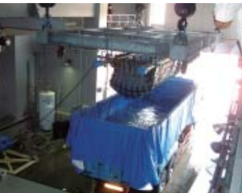
水族館搬入口に到着したジンベエザメ