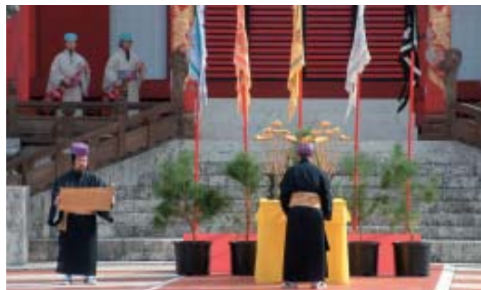
朝之御拝(高官の焼香)