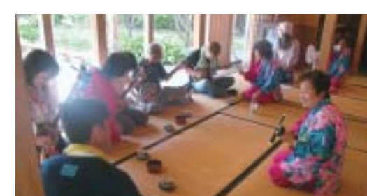
「三線体験」おばあと一緒にゆんたくしませんか?