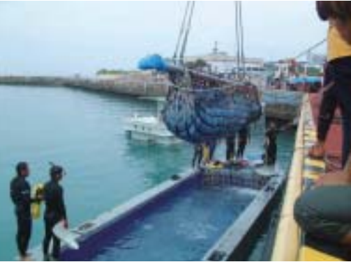
クレーンを使って専用担架で吊り上げる

さえて暗くしてやることです。こうすると一瞬、ジンベエザメの力が抜け、この間に胸ビレの後ろを押し、コンテナの中へ押し込みます。コンテナの中へ入ったジンベエザメは尾ビレを激しく振るなど落ち着きがない様子ですが、しばらくするとおとなしくなります。その後、全長や性別の確認、採血などを行い、それから輸送を開始します。漁船での曳航中は、コンテナの前と底の部分に開けられた穴(スカッパー)より常に新鮮な海水がジンベエザメのエラ孔(あな)の方向へ流れていきます。これによりジンベエザメの呼吸を確保します。しかし、普段泳ぎながら呼吸をしているジンベエザメがコンテナの中で止まったままになっていくことはかなりの負担であることに代わりはありません。搬送中は呼吸や定置網、コンテナの中などで負ったすり傷などを中心に注意深く観察します。読谷村の定置網を出発して約6時間で水族館のある本部町に到着します。