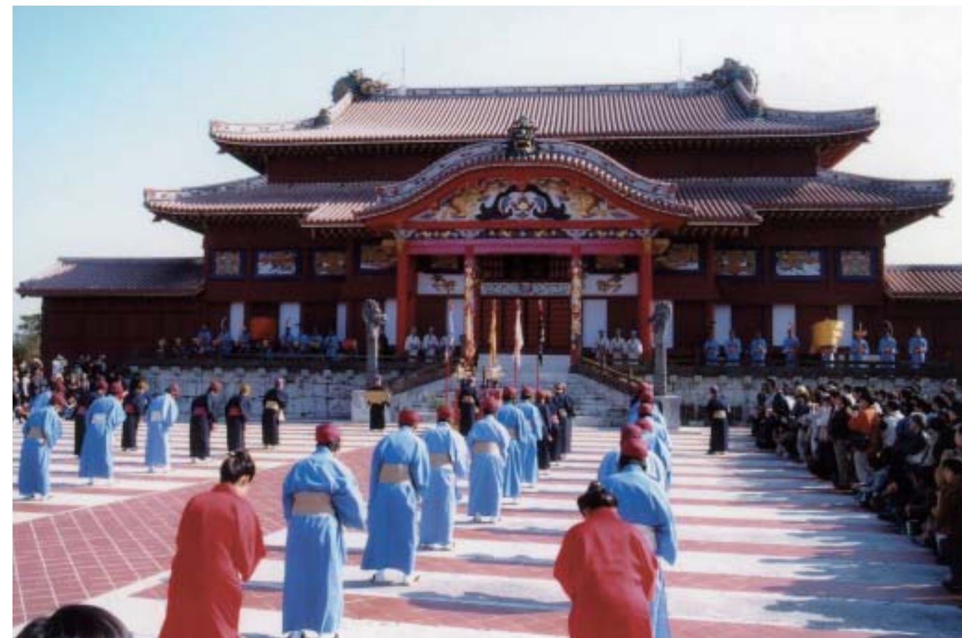
朝之御拝(国王への拝礼)

琉球では、国王の前に香炉を置いて拝みましたが、中国でも同じように香を焚いて拝む「焚香朝拝」が行われていました。 その他、琉球と中国の儀式での類似点が多く見受けられました。