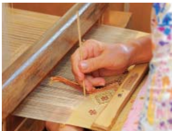
手花織。模様糸を入れているところ