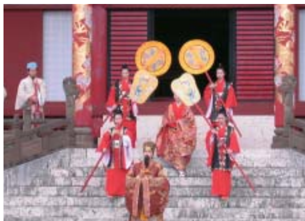
子之方御拝(国王の出御)

儀式の時系列での整理 文献資料の整理を受けて、正月儀式を時間経過に沿って、一覧表にまとめました。その表の中から、主な内容を抜粋します(表参照)。 このような流れで、正月儀式が執り行われたことが、文献資料の整理と儀式の時系列による一覧表の作成によってわかりました。