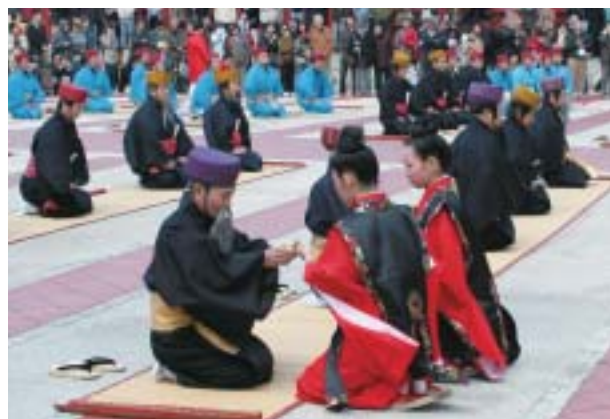
大通り(諸官への振る舞い酒)