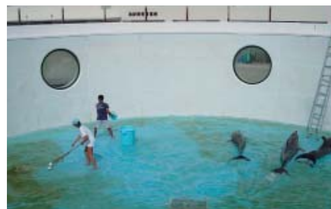
イルカプール清掃(イルカラグーン)

餌料管理 餌料の管理においては品質、鮮度等を良好に保つよう管理し使用しています。良い餌は、動物を健康に飼育していく上で欠かせません。餌は食べやすく、消化が良く、生理的な障害を与えない物質を含まないと望ましく、自然界で鯨類が食べている餌料生物を与えるのが理想です。また、餌料構成としては赤身魚と白身魚を混合し、脂肪分が少なく高エネルギー食とならないように配慮しています。また、栄養バランスや嗜好性の固定をなくすため、丸餌や切り身などのサイズや形状に変化を与え、定期的に体重測定を行うことで各個体の給餌量を決定しています。一般的には体重を維持するための給餌量は、1日あたり体重の4%〜10%の給餌量