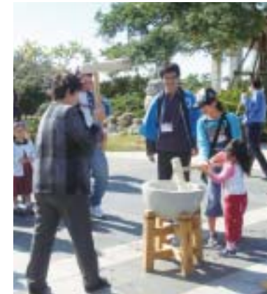
正月催事「新春果報でーびる」餅つき体験

寒さを感じさせない イベントがいっぱい! 海洋博公園 海洋博公園では、沖縄独特の温暖な気候のなか、冬を感じさせないイベントをたくさん用意しています。今年も恒例の「沖縄国際洋蘭博覧会」を熱帯ドリームセンターで二月三日から十二日まで開催します。冬に咲く鮮やかな洋蘭を是非ご覧になって下さい。 沖縄美ら海水族館では、「南海の巨鯨と巨魚!! 大動物展」を開催します。大型の鯨や魚の体の仕組みの違いや、餌の捕り方などを紹介します。またお正月は恒例の「新春果報でーびる」を二月一日から三日まで開催します。家族みんなで遊べる体験イベントや、沖縄のお菓子振舞いなどを行いますので、ふるってご参加下さい!! 詳しい内容は下記をご覧ください!