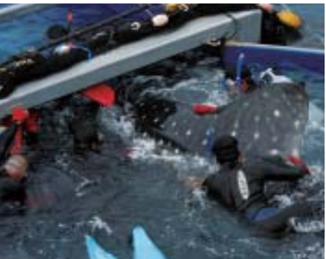
ジンベエザメをコンテナ内へ誘導

ジンベエザメが定置網に入るとこのコンテナを落網の部分に設置し、コンテナの扉を網の中で開きます。その後、ジンベエザメをコンテナの中へ入れるため網を絞っていきます。網を絞っている最中、飼育係は6名ほどでジンベエザメが網のたるんだところへ入り込まないよう注意深く観察します。最初、水深40mほどあった網の底もジンベエ