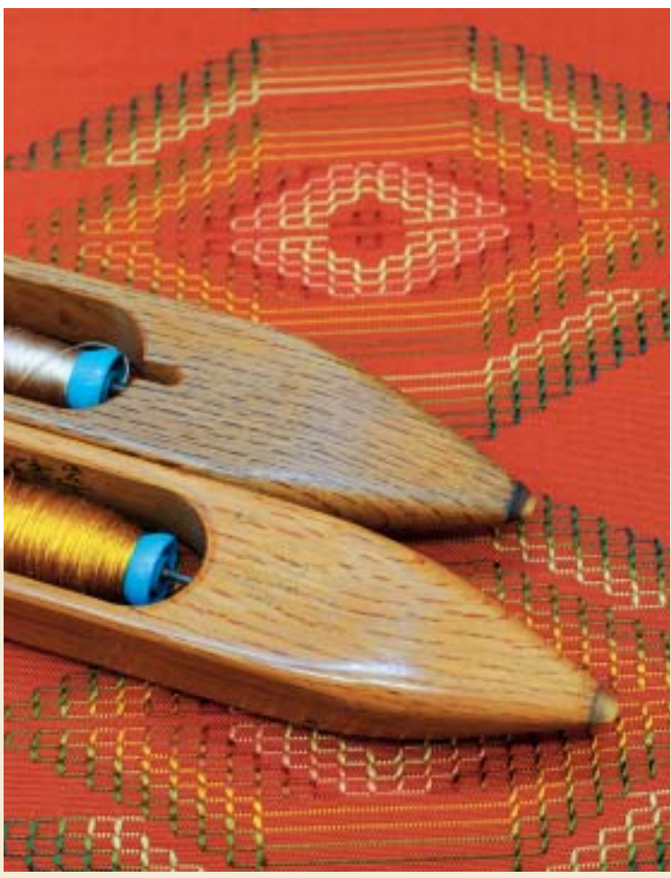
手花織の帯地と杼(ひ: 緯糸を巻いた管を入れるもの)