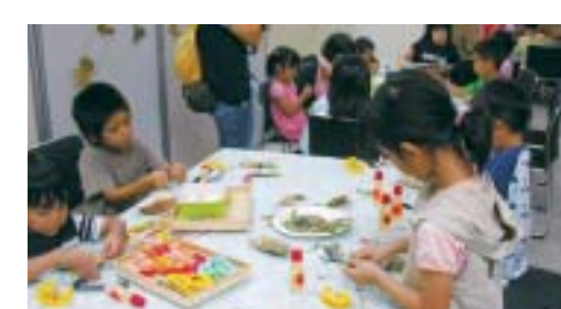
「植物のクラフト作り」のーコマ