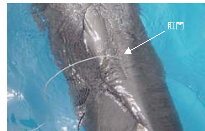
プローブを約15cm挿入し直腸内の温度をはかる

治療 主に、客観的な方法である血液検査や細菌・真菌学的検査の結果により治療を開始しますが、必要に応じてX線検査や超音波画像診断、内視鏡検査を行い、より確実な診断を基に治療を開始する場合もあります。基本的には経口投与により抗菌薬等を与え動物に負担をかけるずに治療を行います。状況によっては筋肉内注射や静脈内注射での処置も行っています。しかし、国内における疾病治療技術は未だ確立されていない現状にあります。当館においては、健康管理技術の向上を目指し日々努力し、独自に行う研究のほか、他の医療機関、大学研究機関と共同研究を行い飼育技術の向上に努めています(写真・写真)。