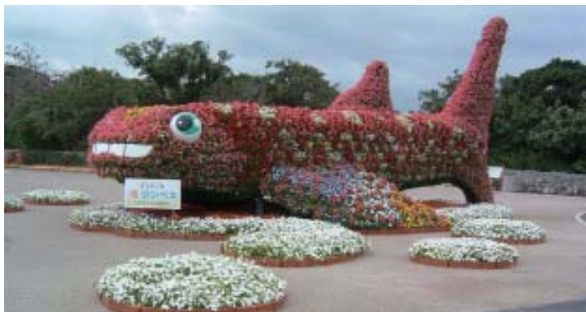
動物シリーズ・ジンベエザメ

るものとして平成14年度からこれまでにない大型の造形花壇の制作に取り組み、来園者の満足度を高めるとともに、地域にもその技術を活用し、美化並びに緑化を推進しています。