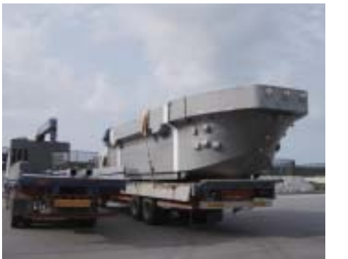
FRP製曳航コンテナ (外寸：長さ9.0m、幅3.2m、高さ2.0m)