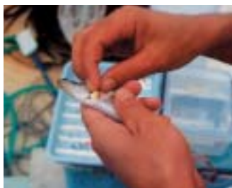
経口投与=エサの魚に薬をつめる