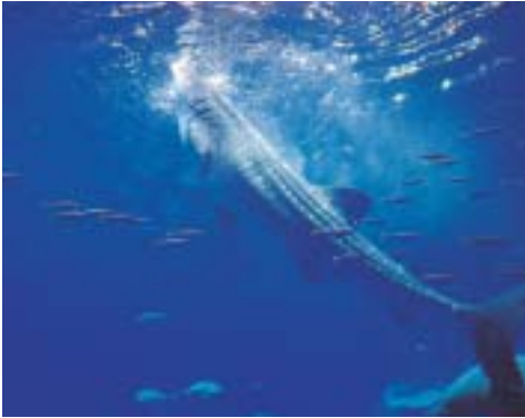
垂直泳ぎでエサを食べるジンベエザメ(黒潮大水槽)

サメと言うと凶暴なイメージがありますが、ジンベエザメは動物プランクトンや小魚などの小動物をエサとしており、人に危害をくわえる事はありません。エサの食べ方は豪快で、まわりの海水ごとエサを吸い込み、鰓板(さいばん)といわれる器官を使って、エサだけをこしとって食べます。余計な海水はエラ孔(あな)より排出されます。一度に吸い込む海水の量は100ほどで、垂直(水面に対して)に立ち泳ぎをしながらエサを食べます(写真)。