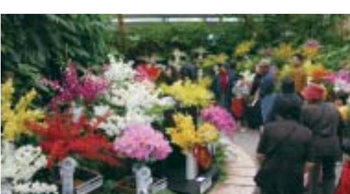
世界の蘭が一同に「沖縄国際洋蘭博」

植物のクラフト作り 植物を使ったクラフト作りで、楽しくカレンダーやかわいい金魚・馬を作ってみませんか? 12月26日(火)〜3月31日(土) 8:30〜17:30 内容:カレンダー作り(12/26〜1/31)/アダンで金魚作り(2/1〜2/28)/フイで馬グラー作り(3/1〜3/31) 定員:無し 申込方法:当日申込(10名以上は要予約) お問合せ/植物園 TEL0980-48-3782 ) 場所 都市緑化植物園 無料