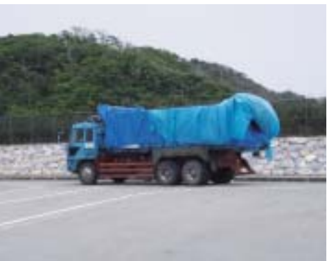
10トンダンブ荷台の仮設水槽での陸上輸送

定置網や海上生簀などから近くの港までは、曳航コンテナで移動します。港でジンベエザメを吊り上げる際には、60トンクレーンを使用します。吊り上げは、コンテナごとではなく、ジンベエザメだけを専用の担架を使って行います。この担架はクレーンで吊り上げる2本の鉄製の棒にターボリンシート(塩化ビニール製シート)でジンベエザメを包む袋と補強のため外側にモッコ(荷役用のベルトを網目状に縫ったもの)を取り付けたものです(写真)。吊り上げたジンベエザメは、10トンダンブ