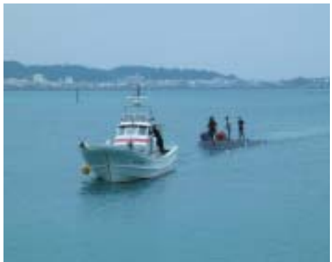
曳航コンテナでの海上輸送

海上輸送には、船形の曳航コンテナを使います。大きさは外寸で、長さ9・0m、幅3・2m、高さ2・0mです。船といってもエンジンや操縦する舵などはなく、ジンベエザメを出し入れする扉が後ろにあるくらいで、ごく簡単な作りになっているFRP製コンテナです。移動の際は漁船で曳航します(写真)。