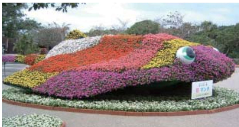
動物シリーズ・マンタ

はじめに 草花を用いた飾花技術は、1990年に開催された国際花と緑の博覧会以降急速に進展し、平面的にデザインされたものから、ハンギングバスケットやウォールポット（壁掛け）、金属製のポール、スタンドを用いた立体的なものなどが普及して来ました。最近では、金属製の枠組みに土壌をつめて固定し、植物をモザイク状に組み合わせ立体的に仕上げるモザイクカルチャーと称される大型の造形花壇が作られ、世界大会が開催されるなど新しい飾花技術が開発されています。こうした立体的に仕上げる技術により、見る人に驚きと感動を与え、展示効果を高めています。当財団では、公園のテーマである「太陽と花と海」の「花」を強く印象づけ