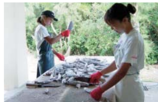
イルカの餌づくり

とされており、成長過程にある若い個体の給餌率は高くなります。当水族館では平均7%の餌を与えています(写真)。